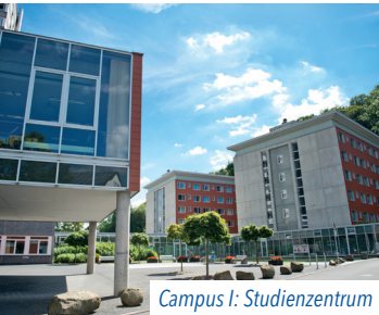
Campus I: Studienzentrum