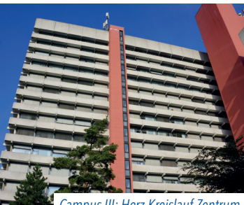
Campus III: Herz-Kreislauf-Zentrum