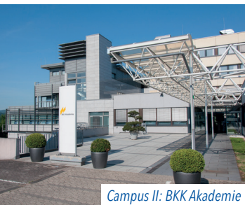
Campus II: BKK Akademie